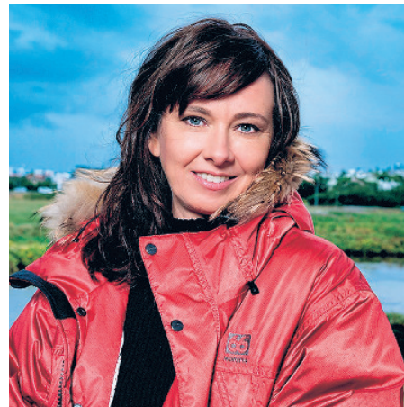
El mundo de Yrsa Sigurdardóttir se mueve en el silencio

El énfasis moroso en el entorno de los personajes en detrimento de la acción