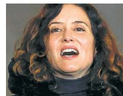
Isabel Díaz Ayuso

Després que aquesta setmana hagi estat "blanquejada" mediàticament amb l'entrevista que li va fer Elon Musk a la seva xarxa X, la líder del partit d'extrema dreta Alternativa per a Alemanya (AfD) va ser ratificada a cancellera en un congrés en què va reiterar amb orgull les seves proclames xenòfobes i va assegurar que faran repatriacions massives. p.19