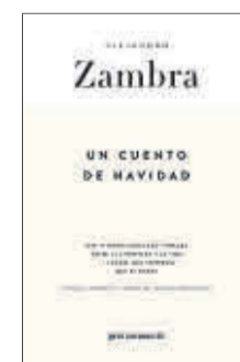
Un cuento de Navidad Alejandro Zambra Gris Tormenta 11,50 €

¿Cómo es la relación entre un autor y su editor? ¿Cuál es la influencia que ejerce uno en el otro? En este volumen de textos de Alejandro Zambra, el lector es testigo de la formación del triángulo invisible entre esos dos interlocutores y el libro. Una obra que posibilita la rara oportunidad de presenciar la naturaleza individual y subjetiva de esa dialéctica: lo frágil y particular, también fuerte, que puede llegar a ser.