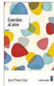
Cuerdas al aire Juan Pablo Caja Editorial Minúscula 14,50 €