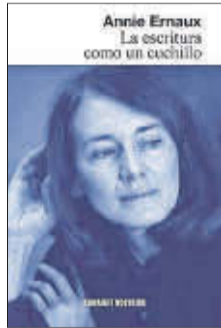
La escritura como un cuchillo Annie Ernaux Cabaret Voltaire. 19,95 €