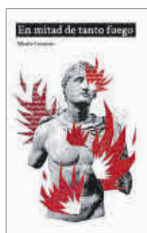
En mitad de tanto fuego Alberto Conejero Dos Bigotes. 15,95 €

Tomando como punto de partida el canto XVI de la Iliada , Alberto Conejero brinda en su nueva obra teatral una aproximación personal e íntima al poema de Homero, una nueva mirada vivida y contada desde un personaje secundario en el relato habitual, fascinante y misterioso: Patroclo, el «más amado» por Aquiles. Un intento de contar la historia de otro modo, de imaginar el futuro de otro modo.