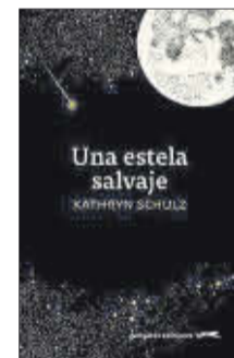
Una estela salvaje Kathryn Schulz Gatopardo 21,95 €

Tomando como punto de partida el canto XVI de la Iliada , Alberto Conejero brinda en su nueva obra teatral una aproximación personal e íntima al poema de Homero, una nueva mirada vivida y contada desde un personaje secundario en el relato habitual, fascinante y misterioso: Patroclo, el «más amado» por Aquiles. Un intento de contar la historia de otro modo, de imaginar el futuro de otro modo.