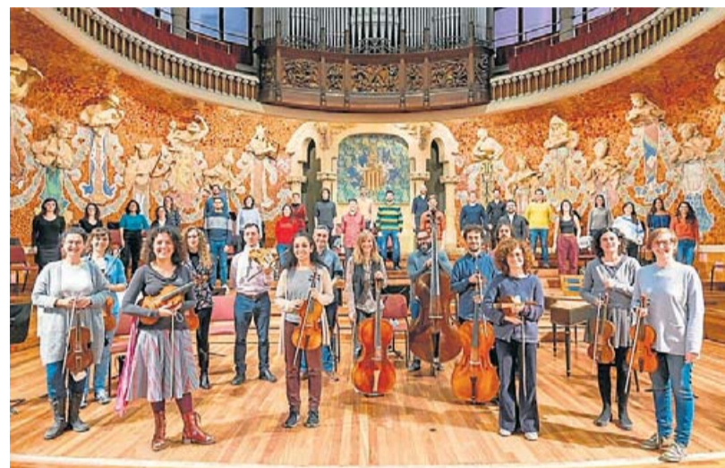
El Bach Collegium Barcelona en una imatge d'arxiu al Palau de la Música.

El compositor destaca la "gran qualitat" d'un festival que no es fa a Barcelona