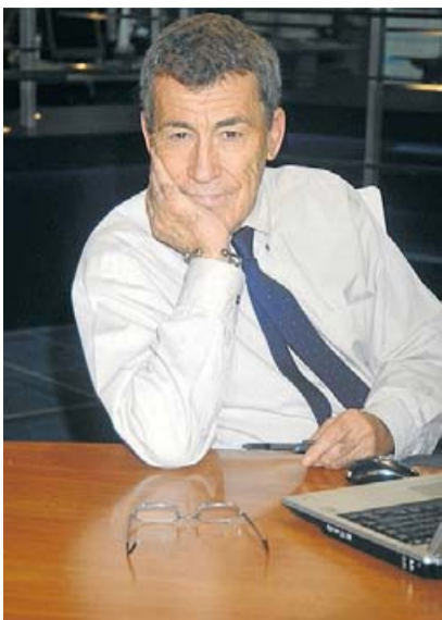
L'escriptor Fernando Sánchez Dragó.