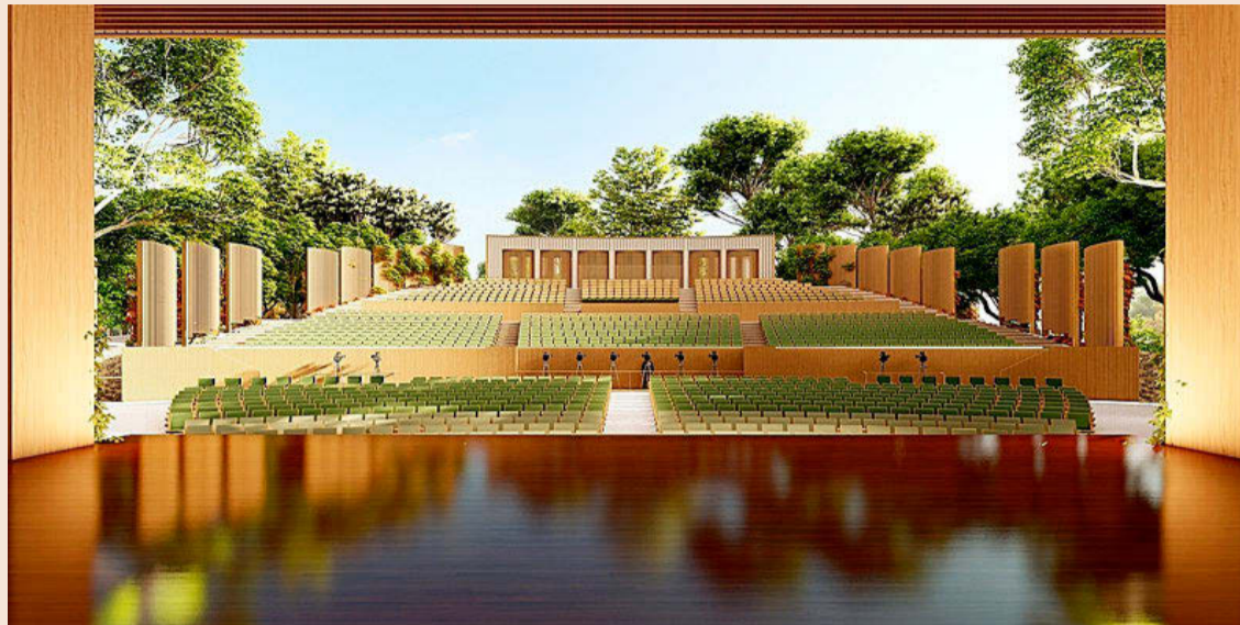
Imagen virtual del futuro auditorio del Castell de Peralada.