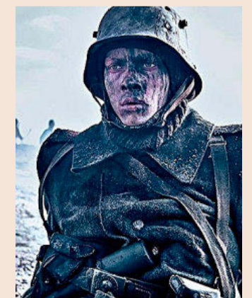
'Sin novedad en el frente' se alzó con siete premios Bafta en Londres.

Almas en pena de Inisherin , dirigida por Martin McDonagh, logró los premios a mejor actor y actriz de reparto para Barry Keoghan y Kerry Condon, respectivamente, y el galardón de mejor filme británico. Por su parte, Pinocchio , de Guillermo del Toro, se hizo con el galardón a mejor película animada.