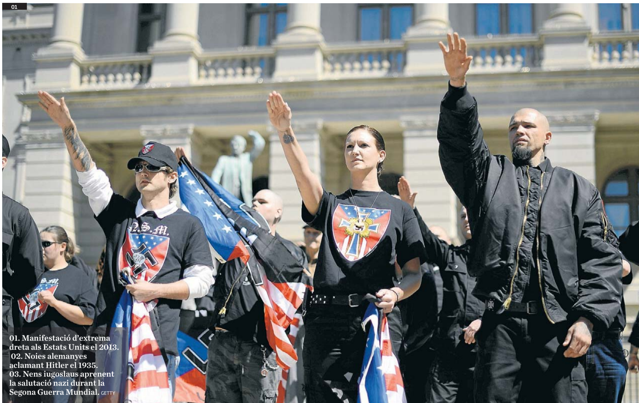
01. Manifestació d'extrema dreta als Estats Units el 2013. 02. Noies alemanyes aclamant Hitler el 1935. 03. Nens iugoslaus aprenent la salutació nazi durant la Segona Guerra Mundial.