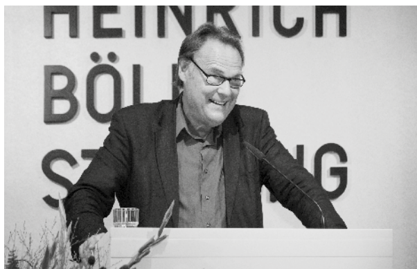
El escritor Peter Schneider en un acto de la Fundación Heinrich Böll, el 20 de septiembre de 2011, en Berlín.