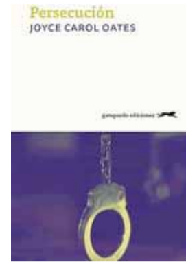
PERSECUCIÓN JOYCE CAROL OATES