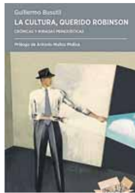
LA CULTURA, QUERIDO ROBINSON GUILLERMO BUSUTIL

Novela. Ed. Instituto Nacional de Cultura, Panamá, 2019. 148 pág., 13 euros.