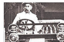
Antonio Gamoneda La pobreza

La pobreza tiene más nombres de los que ha pensado el autor y más asuntos, abre interrogantes, y contiene la vida vivida por uno de los autores más originales de nuestra literatura.