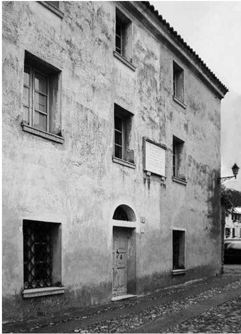
Casa de Grazia Deledda en Nuoro, Italia.