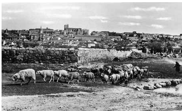
Vista de la ciudad de Ávila en la década de 1950.