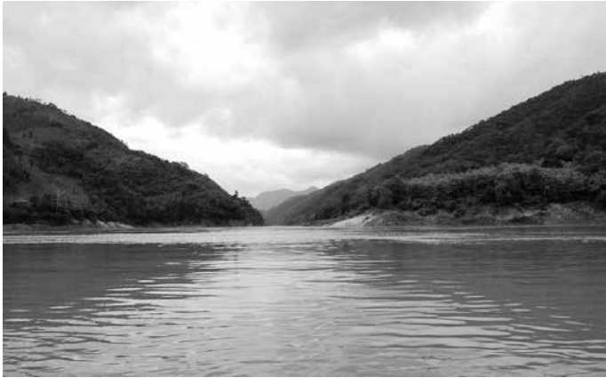
El río Mekong.