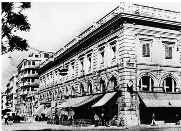
El Extrabar, en la plaza Politeama de Palermo, en la década de los cincuenta.