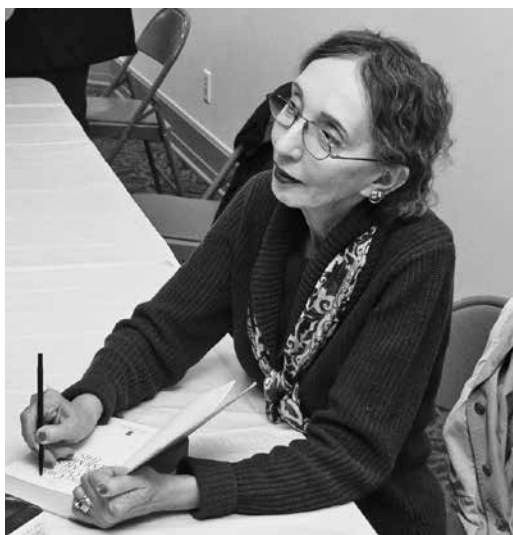
Joyce Carol Oates firmando libros en el festival literario Get Lit!, 2013.