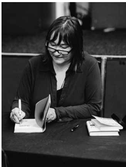
Ali Smith firmando ejemplares en Cambridge, noviembre de 2015.