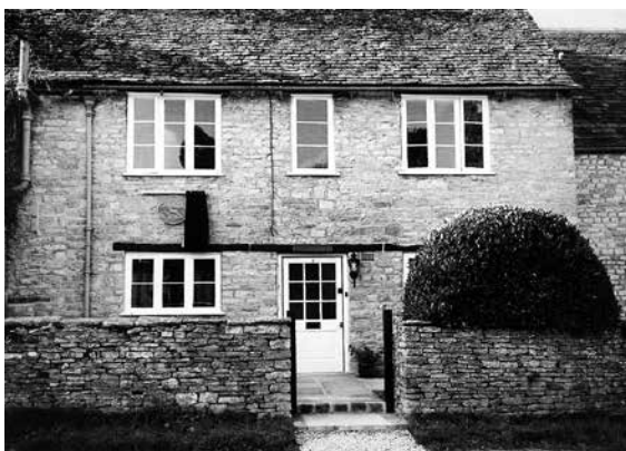
Barn Cottage en Finstock, Oxfordshire, donde Barbara Pym vivió de 1972 a 1980.