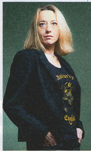
La escritora Virginie Despentes.

Virginie Despentes, Literatura Random House.