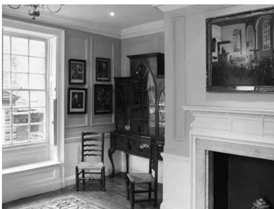
Interior de la casa donde vivió Samuel Johnson, en el 17 Gough Square, en Londres.